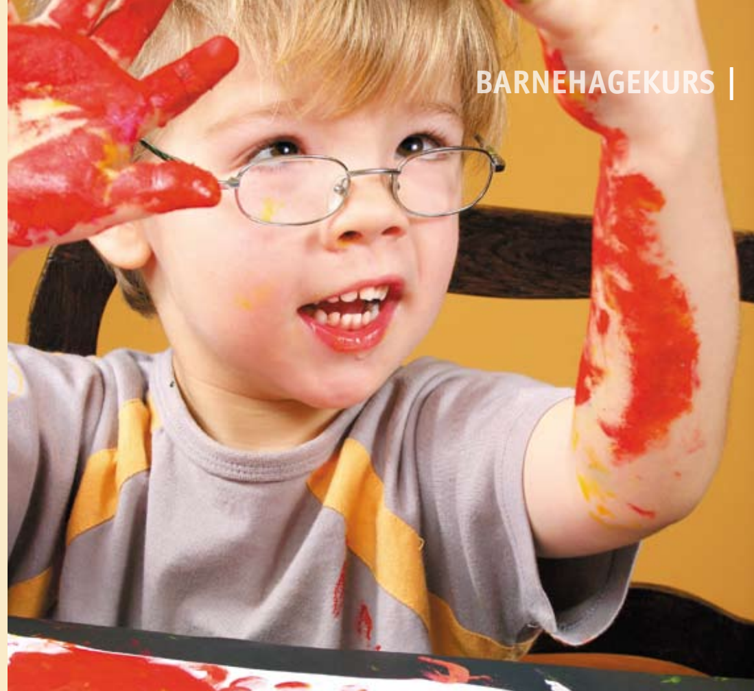
Kunstkaperne. Barna trenger gode forbilder. Ved å tilby ekte kunst og varierte uttrykk, gir vi barna noe å strekke seg etter.

Barnehageansatte kjenner seg tydeligvis igjen når det er snakk om måter barnehager er innredet på. Et kritisk spørsmål er om foreldre har tid og overskudd – på vei til eller fra jobb – til å lese lange veggaviser, studere utallige fotografier og samtidig gi barnet den oppmerksomheten det trenger.