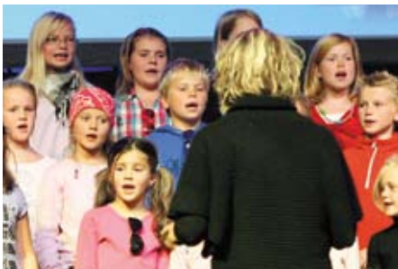
Full scene. Over 150 barn var aktive på scenen tirsdag kveld. Mange sang, noen gjøglet og noen danset.