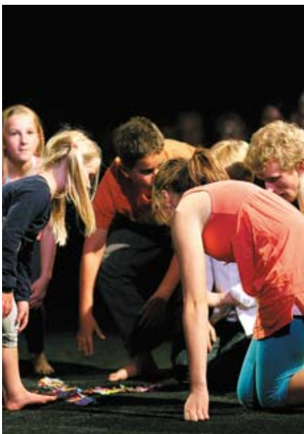
Kveldsdans. Med sommerfuglen som symbolikk danset barn og ungdom fra Lommedalen menighet konferansens tema: «Vi tror!».