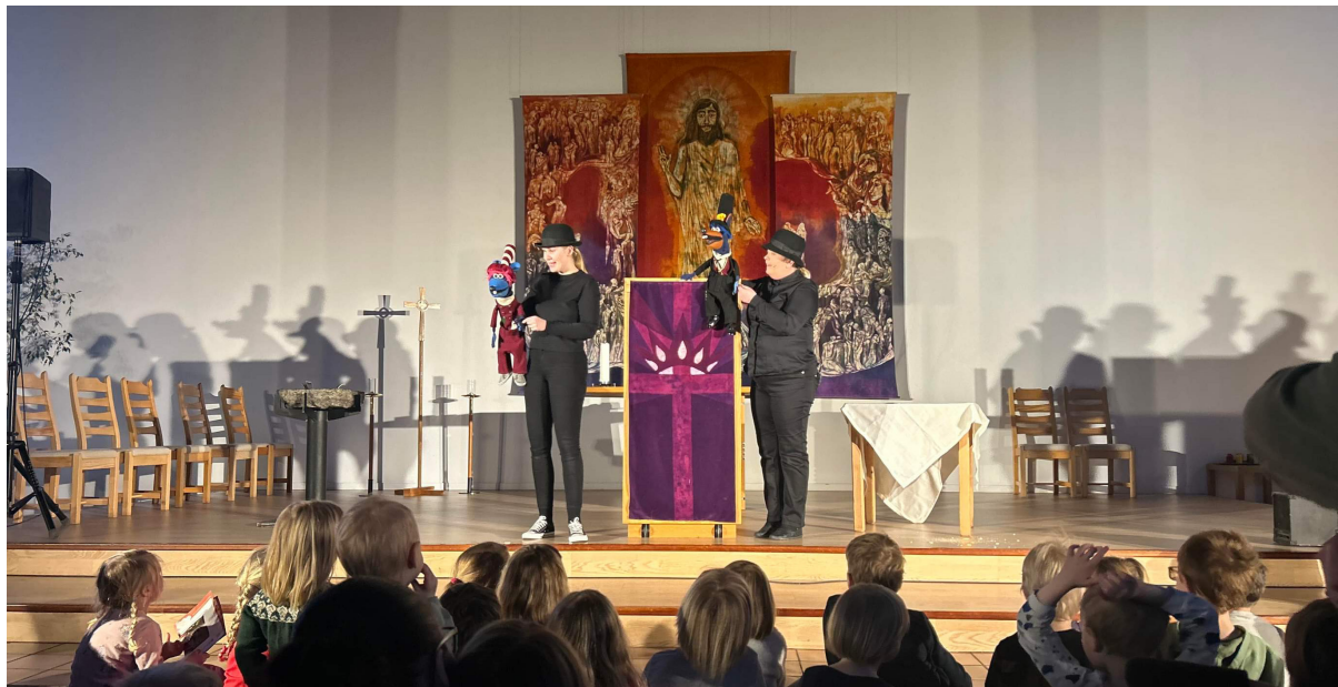
Kirkerottene var i Storhamar kirke i februar, og har vært der hvert år de siste ti årene.